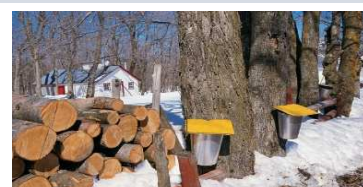
Récolte sève sirop d'Erable